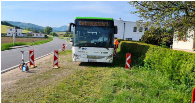
Foto: Auch die Busse aus Kirnberg Richtung Mank werden künftig auf der Dorna-Seite halten.

Die neue Busbucht in Wies bei der Abzweigung Dorna wird im Sommer von der Straßenmeisterei Mank errichtet. Die Busbucht wird so gestaltet, dass die Linienbusse künftig aus beiden Fahrtrichtungen auf der Dorna-Seite halten können. Im Interesse der Verkehrssicherheit ist damit das Überqueren der Straße für Fahrgäste nicht mehr nötig. Dies wurde im Zuge einer Verkehrsverhandlung und einer VorOrt-Befahrung mit dem Verkehrsverbund VOR festgelegt.