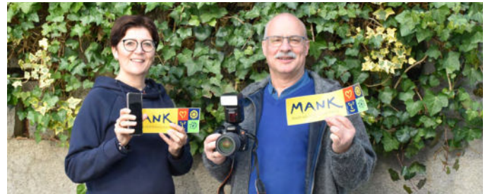
Foto: Andrea Wittmann und Otmar Garschall laden zum Fotowettbewerb ein.

Der Fotowettbewerb „Mank im Bild“ ist in vollem Gange. Erste kreative Einsendungen sind bereits eingegangen und wir freuen uns über viele weitere Bilder.