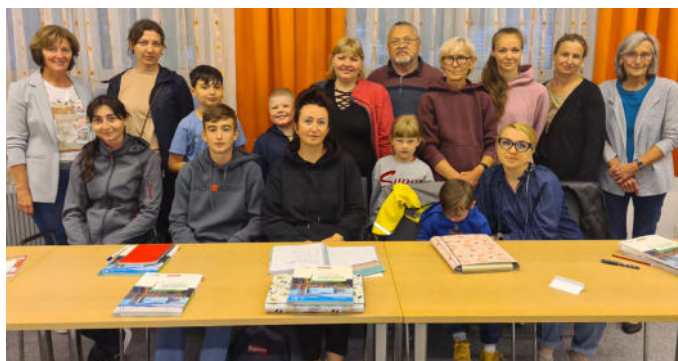
Sehr interessiert und äußerst lernfreudig nahmen die ukrainischen Frauen, Männer und Kinder am Kurs teil.