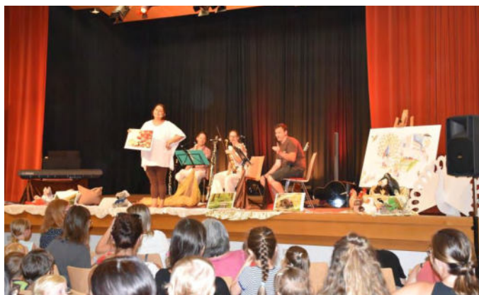
Rund 120 Eltern mit ihren Kleinsten verfolgten die Abenteuer von „Mäuschen Max“ bei der Wanderung durch die Stadt.

Das Ferienspiel startete am Montag, dem 4. Juli für die „Minis“ mit „Mäuschen Max hört auf sein Herz“ mit dem Ensemble „klangmemory“ im Stadtsaal Mank.