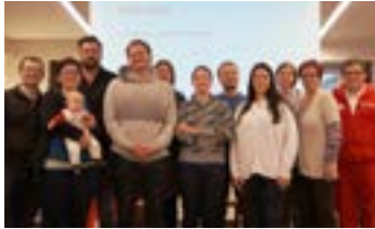
Erste Hilfe Kindernotfallkurs