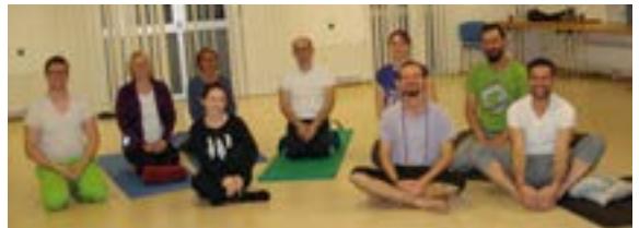
Kriya Hatha Yoga