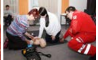
Erste Hilfe Kurs